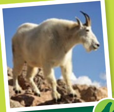
Chèvre de montagne

Caractéristiques Croupe blanche; mâle : épaisses cornes incurvées; femelle : cornes étroites; pelage court de couleur brun pâle Lieux de prédilection À proximité de pentes rocheuses escarpées