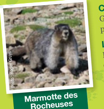
Marmotte des Rocheuses

Caractéristiques Pelage de couleur havane, corps allongé, cri aigu Lieux de prédilection Colonies souterraines dans des prés, au bord des routes et dans des lotissements urbains