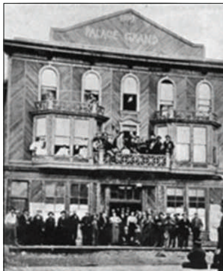
Photo historique du théâtre Palace Grand

Après la ruée vers l'or, Dawson survit grâce à l'ex-