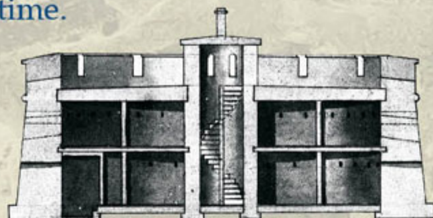
Section Plan of Prince of Wales Tower, 1803 / Plan de section de la tour Prince-de-Galles, 1803 Public Records Office, Ref. No. MPH490(4) / Public Records Office (Londres), No. MPH490(4)

Prince of Wales Tower was the first of almost 200 towers, including five in the Halifax area, built around the British Empire for coastal defence. These structures apparently found their inspiration from a small stone tower at Mortella Point on the Corsican coast which had effectively resisted a joint British naval and land attack for several days in 1794. Though not a prototype for later British towers, which were often built with different features according to their settings, the Prince of Wales Tower did have a long life as an element in the overall Halifax Defence Complex. The time line at the bottom of these panels reveals how its use changed over time.