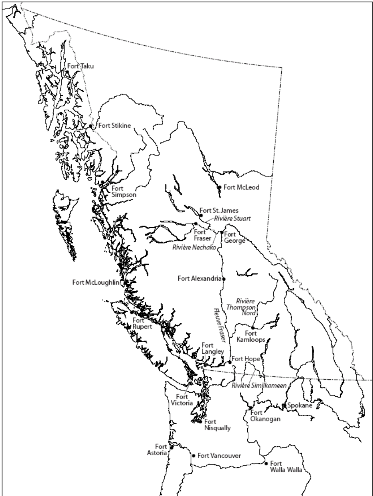
Postes de la Compagnie de la Baie d'Hudson sur la côte Ouest, milieu des années 1800