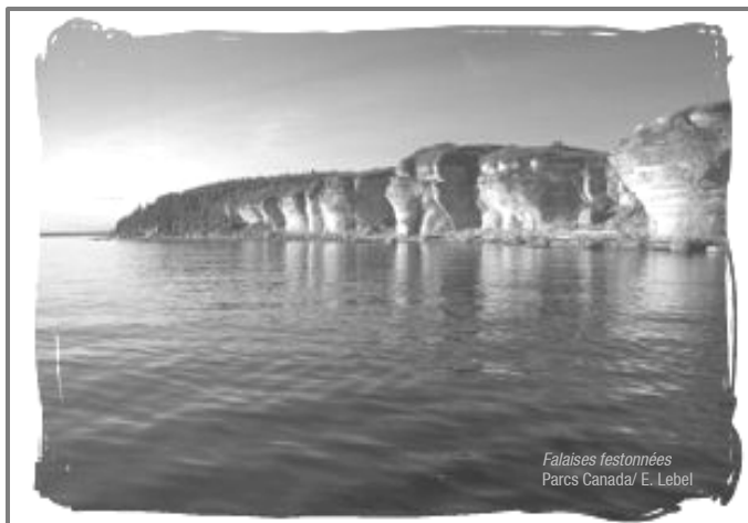
Falaises festonnées