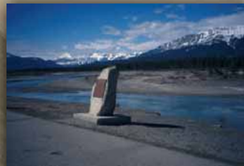
Plaque et cairn commémorant Jasper House sur la route 16 dans le parc national Jasper.

On s'étonne que le nom d'un simple commerçant de fourrures, vivant à une époque et en un lieu si agités, ait ainsi été immortalisé et soit maintenant connu dans le monde entier.