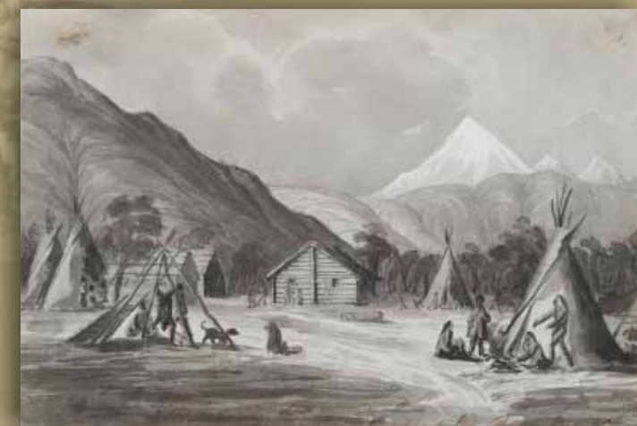
Bâtiments et des tipis à Jasper House II, sir Henry James Warre, 1845.

Au cours des vingt années suivantes, Jasper House sert de relai aux membres de la Compagnie de la Baie d'Hudson qui franchissent les montagnes pour se rendre dans la district de Columbia et facilite le transport des marchandises de traite et des fourrures d'est en ouest.