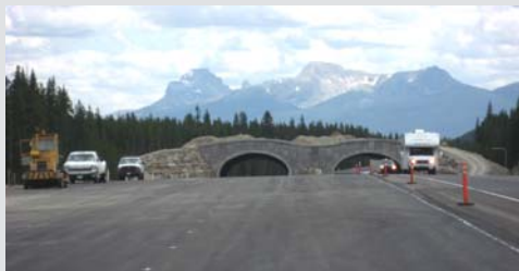
Construction d'un passage supérieur pour la faune, à l'ouest du ruisseau Moraine

Jusqu'à maintenant, plus de la moitié de ce tronçon de 83 km de la route a été élargie. Ces travaux permettront d'améliorer la sécurité des automobilistes, de réduire le nombre d'animaux tués sur la route, de limiter la fragmentation de l'habitat faunique et d'améliorer la circulation des biens et des services.