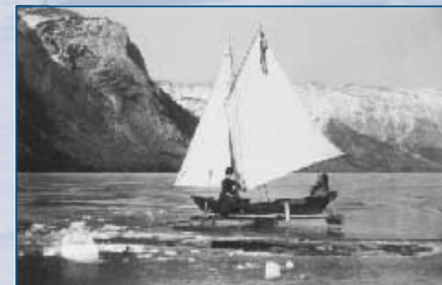
Bateau à glace sur le lac Minnewanka, 1890

Aidez-nous à protéger cette ressource en causant le moins de tort possible et en signalant les cas de vandalisme au service des gardes de parc (1-888-9273367 - sans frais).