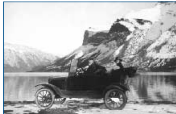
Voiture sur la route Banff/Minnewanka, 1920

Attention : réserver les zones plus profondes aux plongeurs d'expérience. Pour aller d'une jetée à l'autre, les plongeurs doivent traverser des eaux plus profondes : il faut assurer un bon contrôle de la flottabilité pour éviter de descendre plus en profondeur.