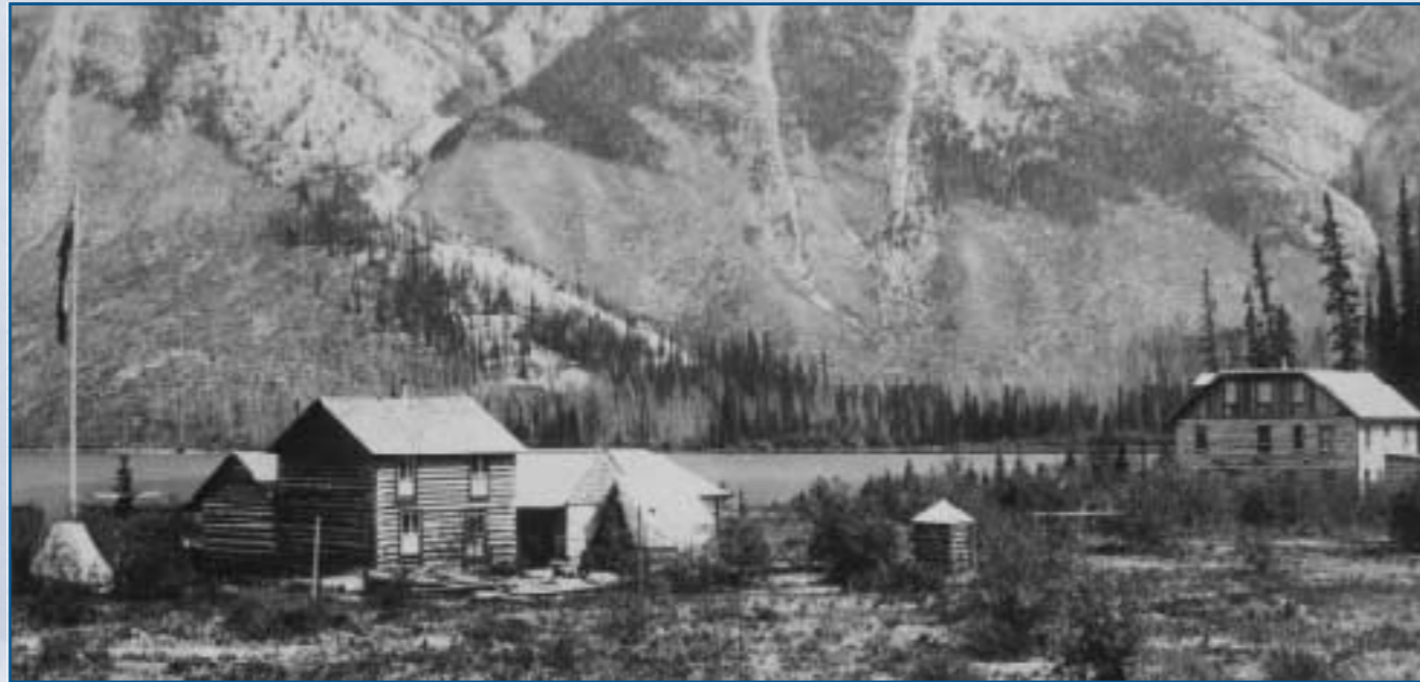
« Hôtels » - Lac Minnewanka, 1890

Le lac Minnewanka a une histoire riche. Il existe des sites archéologiques témoignant d'occupations antérieures aux premiers contacts européens, qui couvrent une période de 10 000 ans. On a trouvé des artefacts remontant à différentes périodes pré-européennes. Le lotissement urbain du lac Minnewanka fait partie de ces sites très anciens dans la vallée inférieure de la rivière Bow. Il existe également des sites historiques comme l'usine hydroélectrique de la vieille cascade et les sites engloutis du lotissement urbain du lac Minnewanka : Minnewanka Landing.