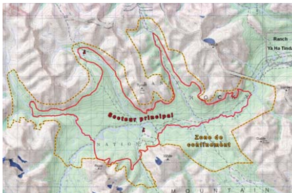
Secteur Red Deer V principal et zone de confinement

Le secteur visé couvre 4 800 ha dans le parc national Banff. De cette superficie, 50 à 60 % seront probablement brûlés. Le secteur longe la limite est du parc, à l'ouest du ranch Ya Ha Tinda et à 51 km au nord du lac Minnewanka.