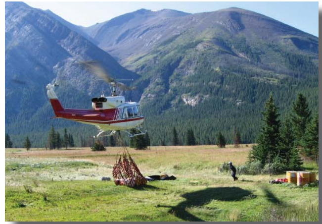
Transport de l'approvisionnement nécessaire au brûlage dirigé du secteur de la rivière Red Deer, 2005

Le public risque d'apercevoir de grandes colonnes de fumée pendant les opérations de brûlage, et une partie de cette fumée pourrait s'attarder dans les vallées environnantes pendant la nuit. Les gestionnaires du feu font tout en leur pouvoir pour réduire la fumée au minimum en choisissant pour les brûlages les périodes où les régimes des vents et les conditions atmosphériques sont les plus favorables. Dans l'étage supérieur, la fumée pourrait se diriger en direction est vers le secteur de Sundre. La fumée ne devrait pas atteindre la vallée Bow, mais elle pourrait.