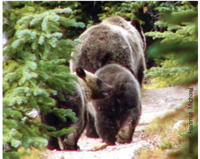
Une ourse grizzly et ses deux oursons parcourent le sentier du Lac-Eiffel

Campeurs de l'arrière-pays : en vertu de l'ordonnance d'accès en groupe, le camping est interdit dans la vallée Paradise pour des raisons de sécurité. Cavaliers : il faut se déplacer en groupe de deux ou plus dans la vallée Paradise.