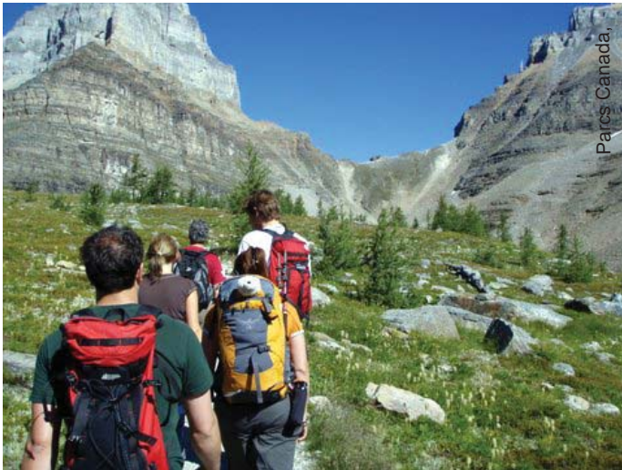
Un groupe serré de randonneurs dans la vallée Larch

lacs Consolation, vallée Larch, col Sentinel, col Wasatch, lac Eiffel, col Wenkchemna est, vallées Sheol et Paradise (voir la carte). Les sentiers du Bord-du-Lac et de l'Éboulement ne sont pas visés par cette ordonnance.