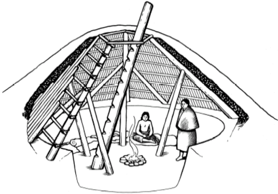
Maison semi-souterraine Artiste : Nola Johnston, 2005